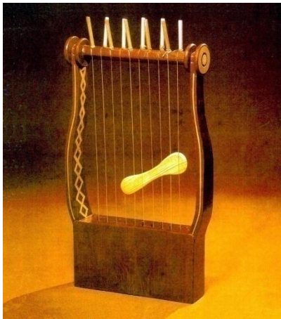
Kennor (oder auch Laute)